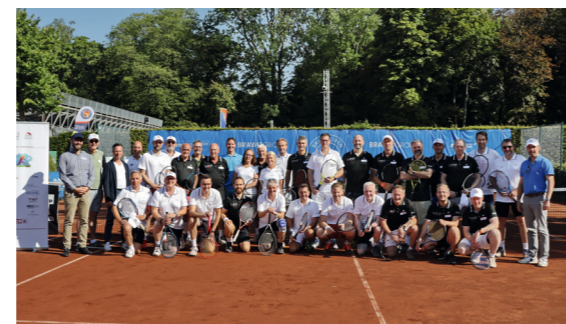
Erfolgreiches Mit- und Gegeneinander auf dem Platz.